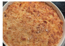
焼きミルクデザート