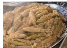
米とハーブを詰めた キャベツロール