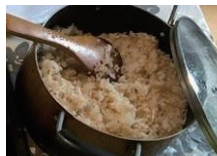
エジプト風ライスと トーストした細麺