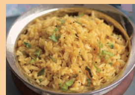
キャベツ入risパイスが効いたまぜご飯