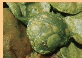
ほうれん草の揚げパン