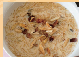
モリナ乾麺のプリン