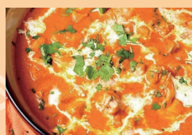
バターチキンカレー