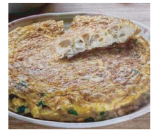
3. 菜圃蛋 (台湾オムレツ)