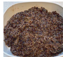
5. 黒糯米飯 (黒米を使った台湾おこわ)