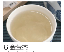
6. 金萱茶 (台湾烏龍茶)