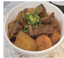
2. 紅焼牛腩 (牛肉煮込み)