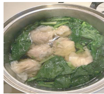
1. 蝦仁餛飩 (海老と豚肉のワンタン)