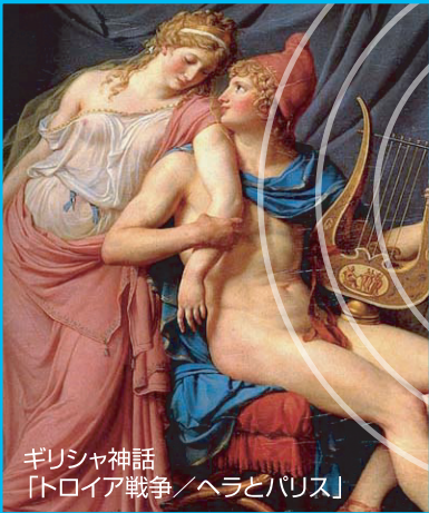
ギリシャ神話 「トロイア戦争／ヘラとパリス」