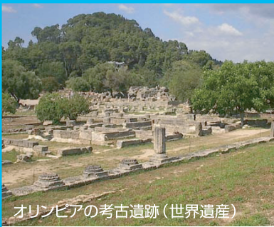
オリンピアの考古遺跡 (世界遺産)